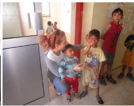
Се грижиме и за најмалите членови од семејствата...