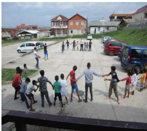
Активности со натпреварувачки дух