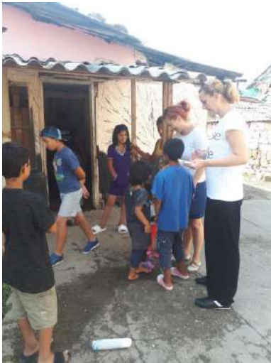
Психо-социјална и правна поддршка на семејства повратници од ЕУ земјите