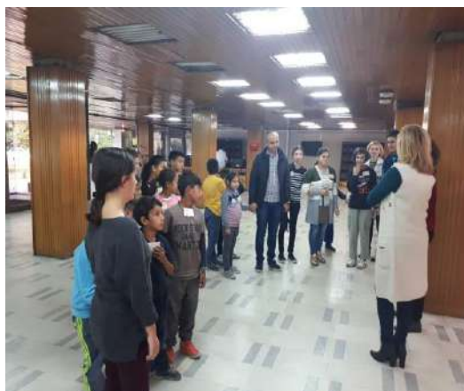
Посета на Универзитетска библиотека Св.„Климент Охридски“