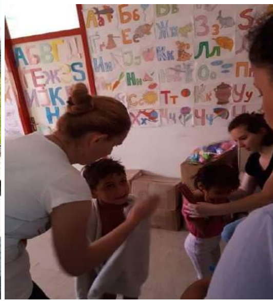
Деца донесени од питачење...